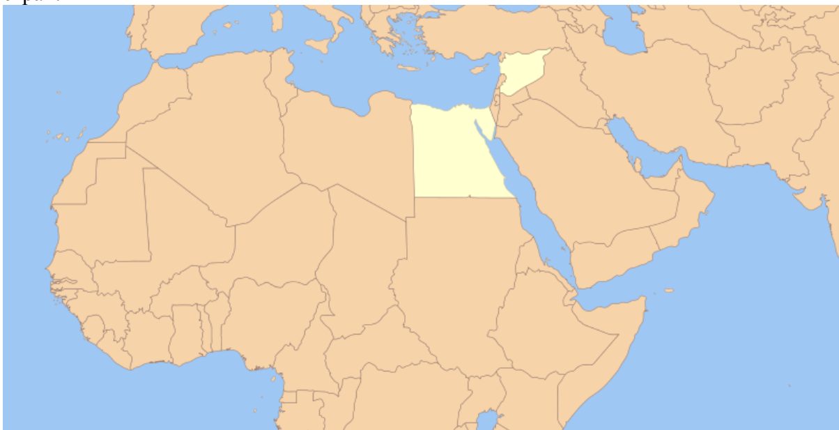
Светлым на карте обозначены Египет и Сирия, страны состоявшие Объединённую Арабскую Республику.

Ещё один пример. С 28 февраля 1958 по 2 сентября 1971 года существовала Объединённая Арабская Республика (ОАР). До 28 сентября 1961 года ОАР состояла из двух стран — Египта и Сирии. Президентом ОАР был президент Египта Гамаль Абдель Насер, а столица в Каире. Создание ОАР было представлено как первый шаг к объединению всех арабских государств и было открыто для вступления в него других стран.