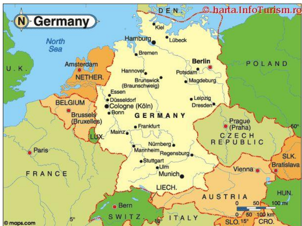
Германия в границах 1990 года

Другой пример такого рода. После Второй мировой войны перед Британской империей встала задача реформирования государственного устройства своих колоний. 15 августа 1947 года Британским парламентом был принят Акт о независимости Индии, в соответствии с которым был осуществлён раздел Британской Индии на Индийский Союз 1 и доминион Пакистан 2 . Временными конституциями новых государств стал немного подправленный Акт об управлении Индией, принятый британским парламентом ещё в августе 1935 года.