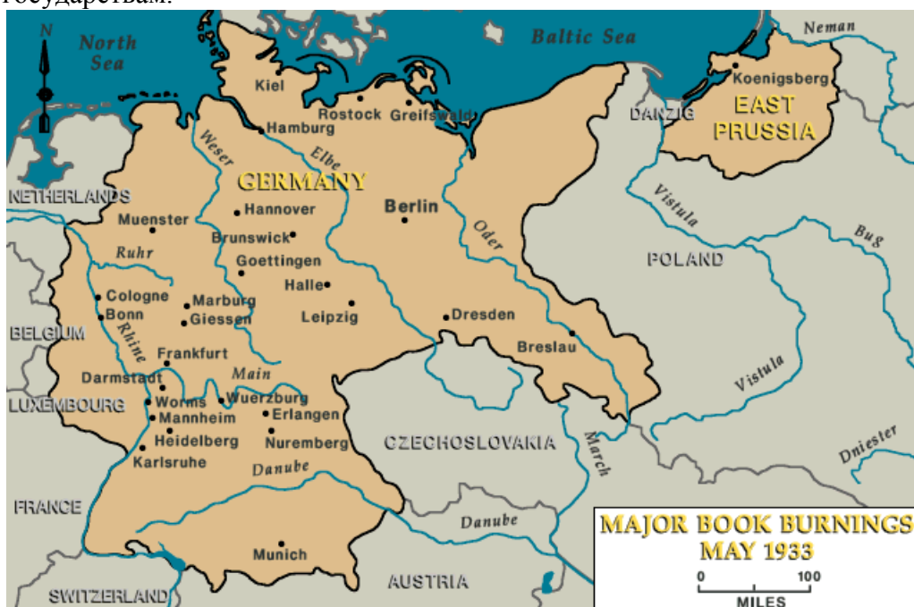
Германия в границах 1933 года

— 3 октября 1990 года ГДР и Западный Берлин вошли в состав Федеративной республики Германия. Германия снова стала единым государством. Но, тем не менее, для единой Германии оказалась потеряна часть территории страны, которая до 1933 года была в составе германского государства, а по результатам II Мировой войны была передана другим государствам.